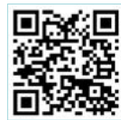
말씀 헌터스 활동 방법