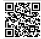
나는 하나님 나라 백성 디폼블록 만드는 방법