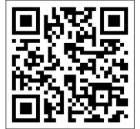
내가 사는 동네 만드는 방법

목 표 내가 사는 동네가 그려진 종이 내비게이션을 만들고, 내비게이션에 구슬을 굴리는 활동을 통해 일상에서 하나님께 충성하며 살아가기로 결심한다.